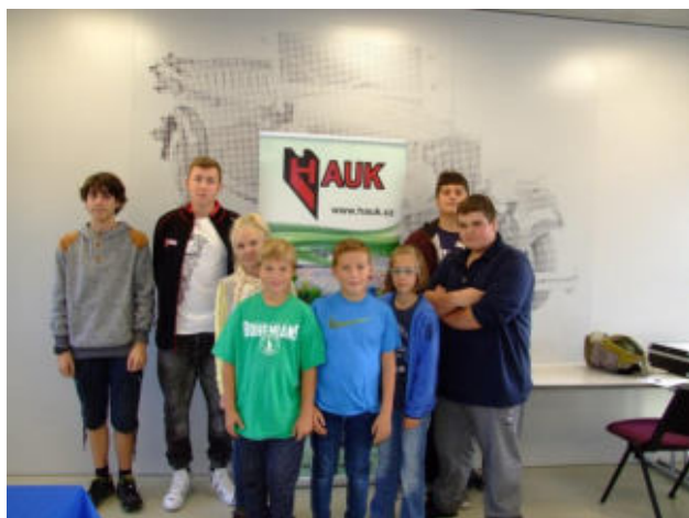
Tým č. 4 – Hauk s.r.o ZŠ a MŠ Police nad Metují SPŠ Otty Wichterleho