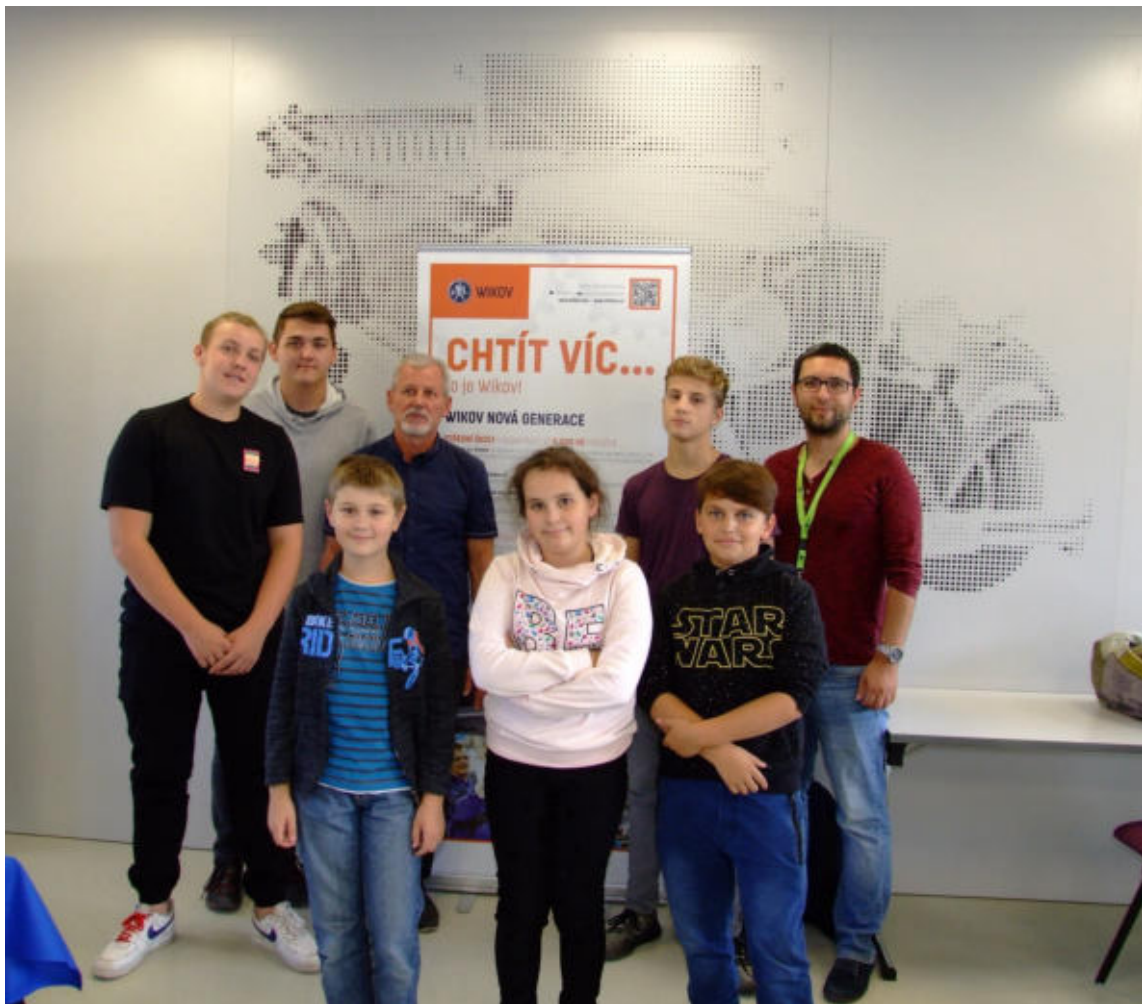
Tým č. 3 – vítěz okresního kola – Wikov MGI, a.s.