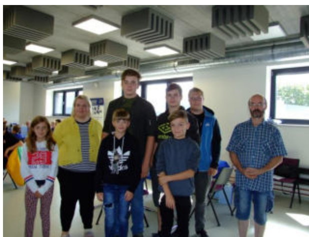
Tým č. 2 – AMMANN Czech Republic, a.s., ZŠ a MŠ Krčín SPŠ, OŠ a ZŠ Nové Město nad Metují