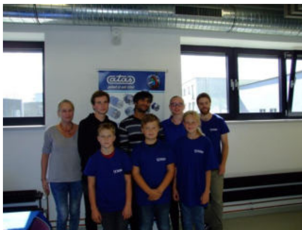
Tým č. 5 – ATAS elektromotory Náchod, a.s. ZŠ Velké Poříčí SPŠ Otty Wichterleho