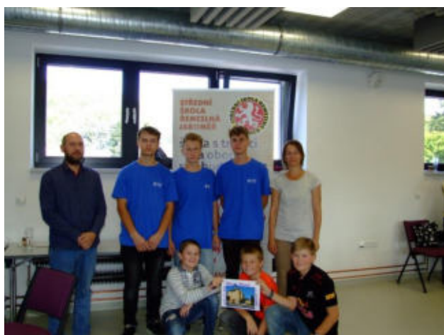
Tým č. 1 – Farnet a.s, ZŠ Boženy Němcové Jaroměř SŠ řemeslná Jaroměř

Obr. 5-6 - Starší členové týmu učí děti jak utáhnout matici, nastavit a změřit předepsanou vůli. Odborná porota hodnotí mnoho technických parametrů.